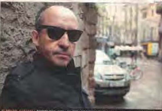
EL REY DEL CABARET • BARCELONA, 2010 • SU CERIA SE REINICIA EN EL MUSICAL 'TURNING POINT' Y LA 'CHANGING'

«Antes estaba harto de que recordaran que soy barón. Ahora le doy la vuelta y juego con ello»